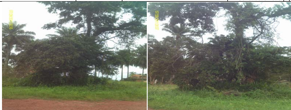
Photo 5: Arbre de la honte (les allemands pendaient sur cet arbre tous ceux qui s'opposaient à leur politique coloniale).