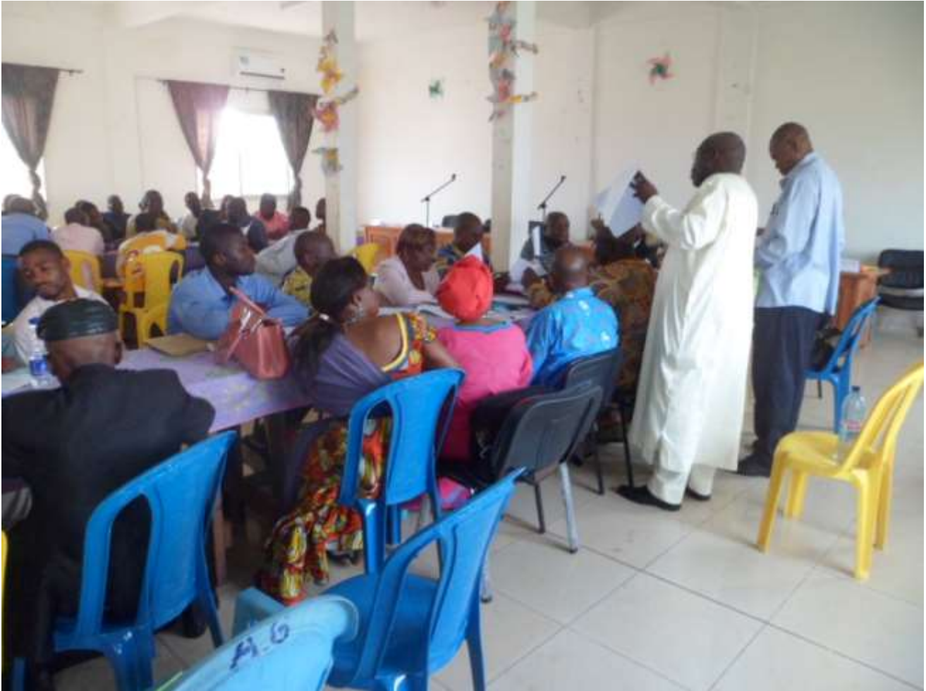
Photo 2 : Atelier de planification, de mobilisation des ressources et de programmation