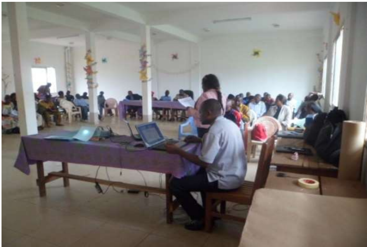
Photo 1 : Atelier de restitution du rapport consolidé des diagnostics participatifs (DIC, DEUC et DPNV)

La photo ci-dessous présente la restitution du rapport consolidé des diagnostics participatifs (DIC, DEUC et DPNV) de Djoum.